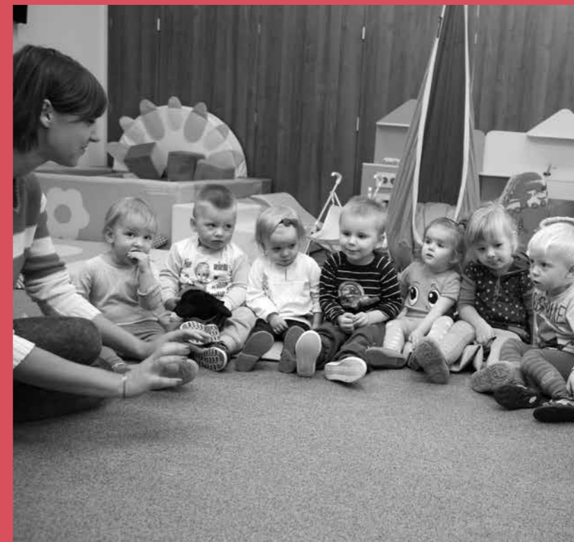
Powitanie w kręgu