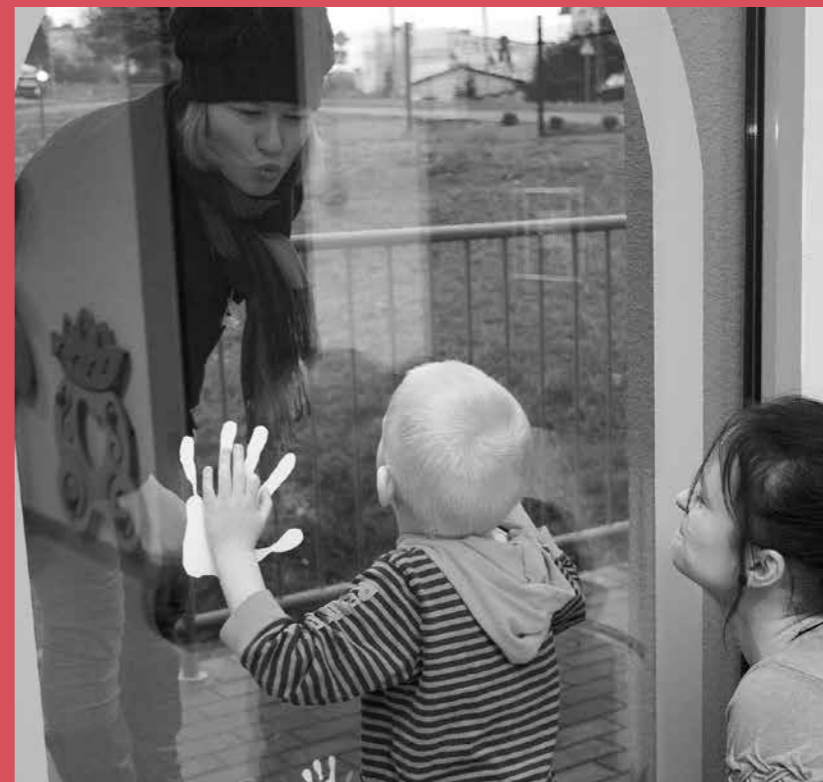
Pożegnanie z rodzicem