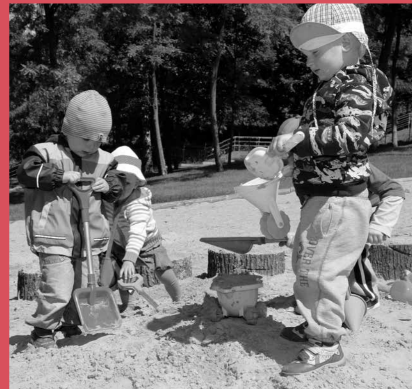
Zabawa na dworze